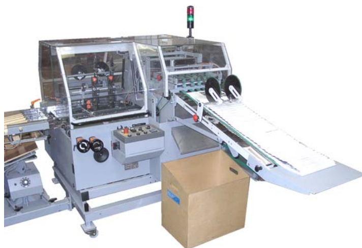
Heft-Falz-Schneid-Aggregat HFS B3