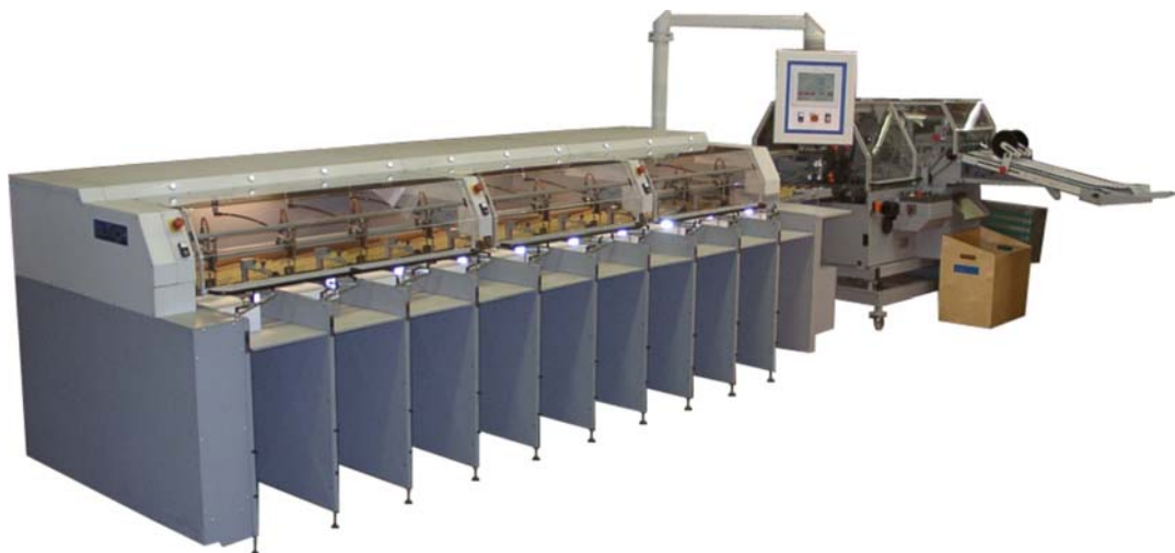
Zusammentragmaschine SECO B3 - 10H mit 10 Hochstapelstationen und Heft-Falz-Schneid-Aggregat