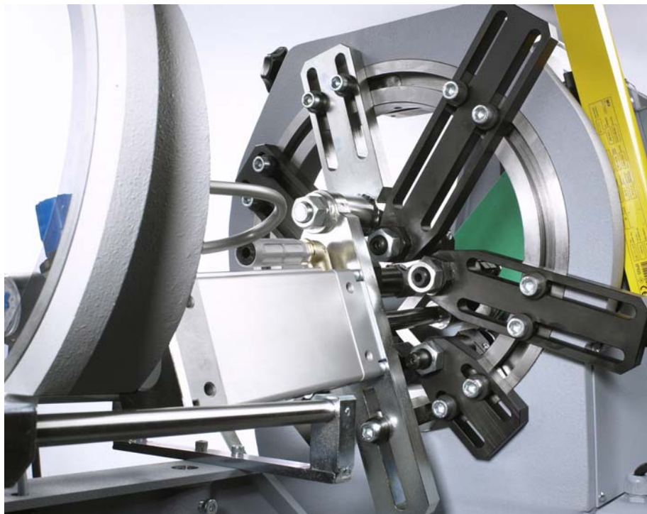
Stanzautomat Typ AL mit Gegendruckeinrichtung GD-A