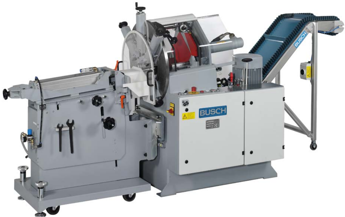
Stanzautomat Typ B und B+P mit Gegendruckeinrichtung GD-1 und Späneförderband KF