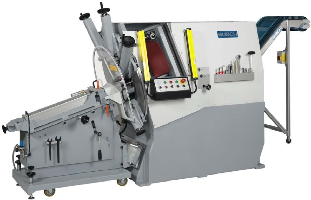
Stanzautomat Typ CL mit Gegendruckeinrichtung GD-3 und Späneförderband KF